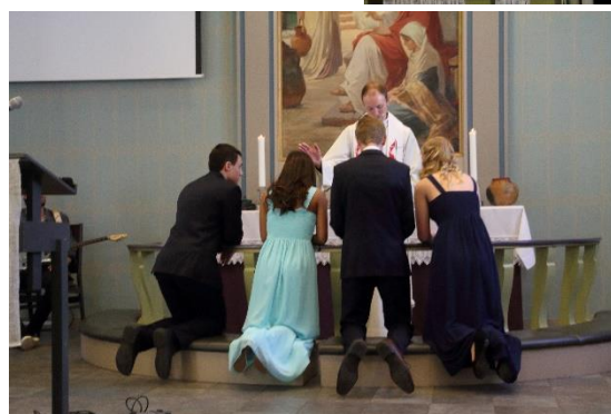
Selve konfirmasjonen med bønn for den enkelte konfirmant