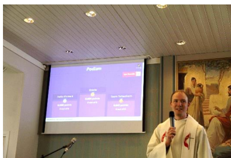
Kahoot utspørring av hele menigheten