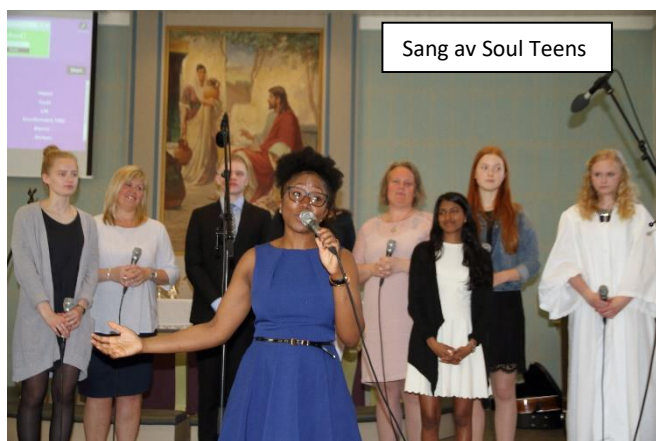
Sang av Soul Teens