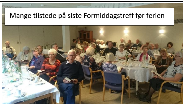
Mange tilstede på siste Formiddagstreff før ferien