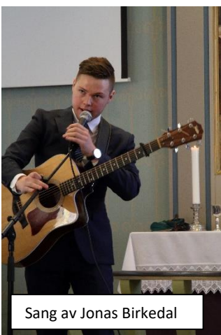
Sang av Jonas Birkedal