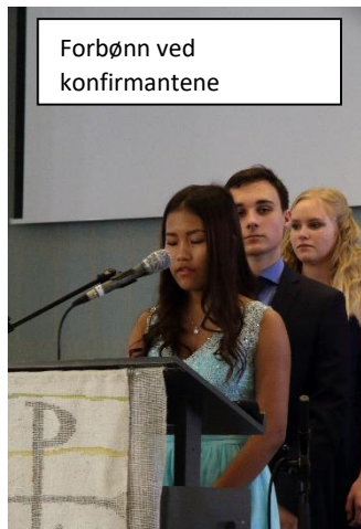
Forbønn ved konfirmantene