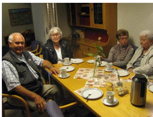
God prat rundt bordene